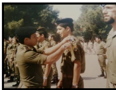
טקס סיום קק"צ 1982