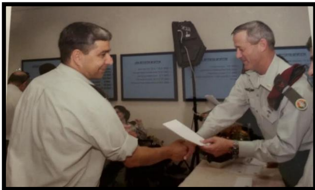
הענקת הצטיינות לבה"ד 20