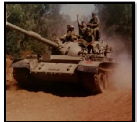
חשמלאי טירן ברפיח