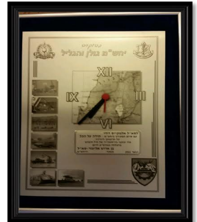
פרסים במהלך השירות