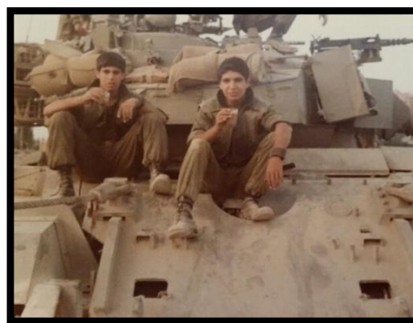
נסיגת צה"ל מלבנון

7. תרומתו הייחודית של חייל החימוש עבור הקצין , חיל החימוש אפשר לדודו להתפתח כקצין מקצועי וכמפקד ונתן לו כלים ניהוליים שאפשרו לו לחנך דור של מפקדים וחיילים ולהטביע חותמו לדורות הבאים בתפקידים אותם ביצע. היום בתפקידיו באזרחות הוא נוכח לדעת עד כמה "ארגז הכלים" אותו רכש במהלך שירותו בחיל החימוש מאפשר לו לבצע תפקידי ניהול בהצלחה רבה.