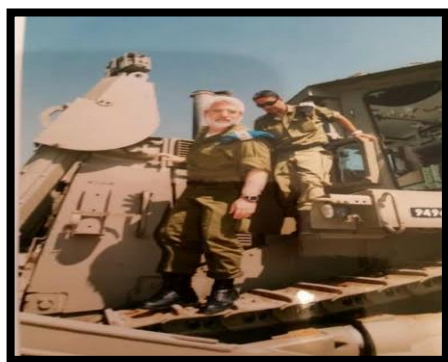
מבצע מיגון רק"מ בעזה