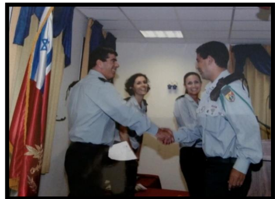
ביקור אלוף פיקוד צפון ביחש"מ